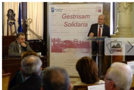
El alcalde, Francisco de la Torre, ayer, en la presentación del balance.

El programa de ayudas directas aplicado por el Ayuntamiento de Málaga, pionero en España, ha supuesto un esfuerzo económico desde 2001 hasta el año 2015 de 5.862.817,72 euros. En el ejercicio 2015 se destinó un total de 810.028,01 euros y aumentó el número de familias beneficiarias con respecto a 2014 en casi un 4%.